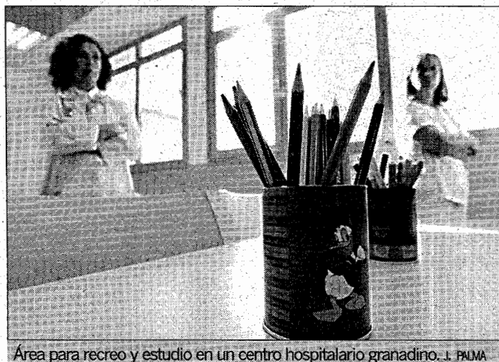
Área para recreo y estudio en un centro hospitalario granadino. I. PALMA

En Granada hay siete aulas hospitalarias, repartidas en los centros sanitarios granadinos Virgen de las Nieves I, Virgen de las Nieves II, San Cecilio y Santa Ana de Motril. El pasado curso estas aulas atendieron a 5.008 escolares. El profesor o profesora hospitalario desarrolla su trabajo en un extenso ámbito de actuación, procurando