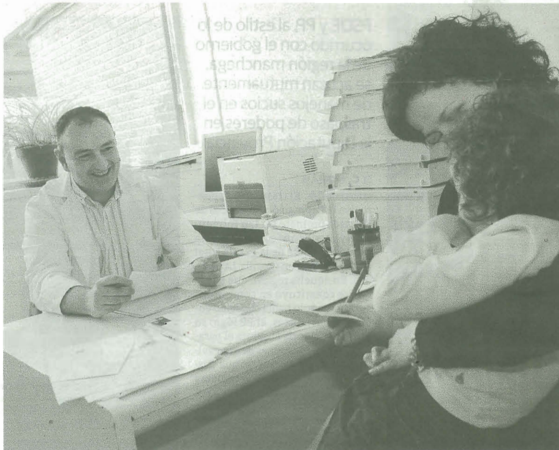
Un médico atiende a una niña en su consulta.

El problema es que nadie ha definido aún a los médicos de atención primaria qué es un hiperprescriptor. Salud no marca cuántas recetas o hasta qué gasto puede llegar un médico de un centro de salud, solo que debe recetar por principio activo y no por marca. El criterio seguido por la inspección del SAS para fijarse en determinados facultativos ha sido comprobar cómo hay